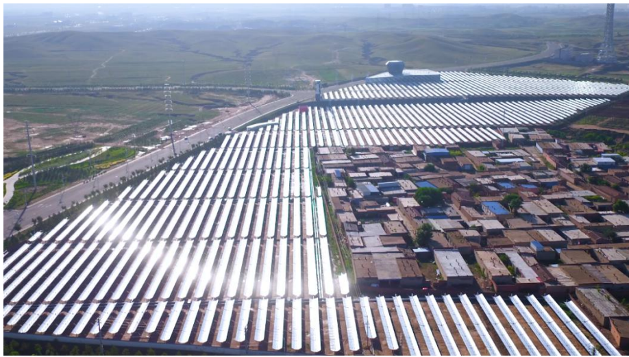
图 1：内蒙古宏庆德村 7.2 万平方米槽式太阳能供暖工程

公司以“技术创新、精益求精”为核心理念，坚持专注于太阳能中高温集热项目研究，目前已拥有 31 项核心专利、百余项自主知识产权技术，曾获得由联合国可再生能源促进中心颁发的全球十大领先技术——“蓝天奖”专利技术。